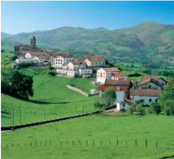
a) montaña / aldea / casas

2 Observa estas fotografías. Luego, descríbelas en voz alta sin utilizar las palabras que figuran debajo.