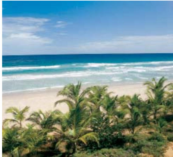
b) palmeras / mar / playa